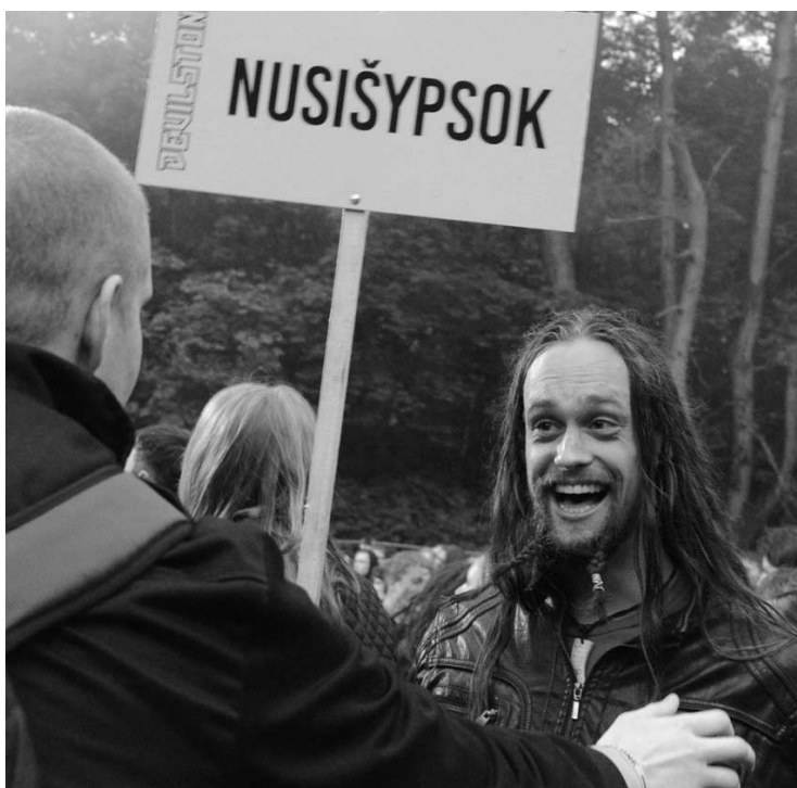
Kaip ir kasmet, festivalio „Devilstone“ dalyviai – draugiški,