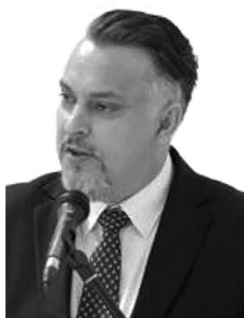
Vyriausybės atstovo Utenos apskrityje Imanto Umbražiūno nuomone, skęstančiųjų gelbėjimas yra pačių skęstančiųjų reikalas.