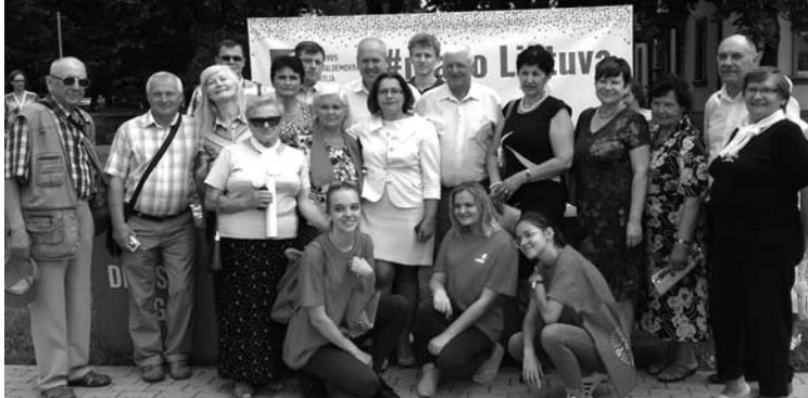
Į politinei agitacijai skirtą renginį susirinko aktyviausi vietos socialdemokratai.

Po Lietuvą keliaujantis Lietuvos socialdemokratų autobusiukas šį antradienį užsuko į Anykščius. Šalia Anykščių kultūros centro skambėjo partijos pirmininko, premjero Algirdo Butkevičiaus balsas. Tiesa, paties A. Butkevičiaus čia nebuvo – su susirinkusiais jis bendravo per „Skype“ programą.