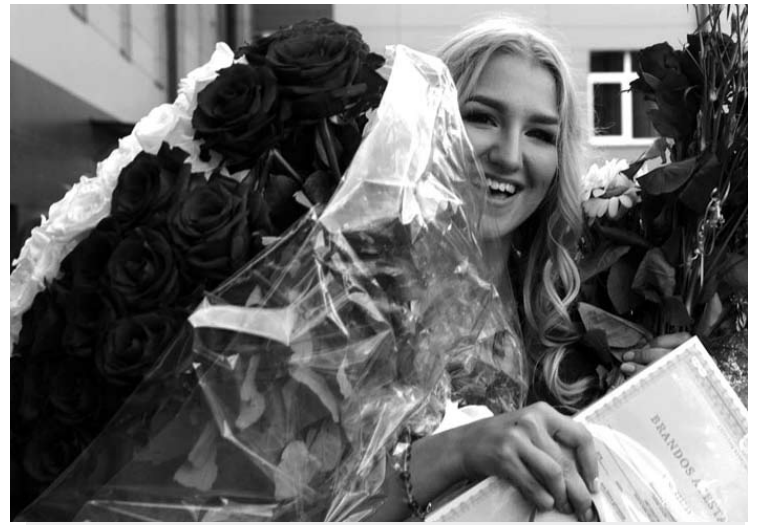
Gėlėmis turtingos išleistuvės...

Po iškilmingo brandos atestatų įteikimo gimnazijos kiemyje abiturientai švęsti išvažiavo į Taujėnų dvarą (Ukmergės r.). Klasicistinio stiliaus rūmuose susirinko apie du šimtus svečių – pobūvyje nedalyvavo gimnazijos vadovai, neatvyko ir dalis gimnazistų.