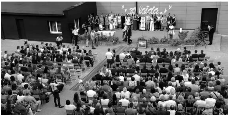
Giedamas gimnazijos himnas...