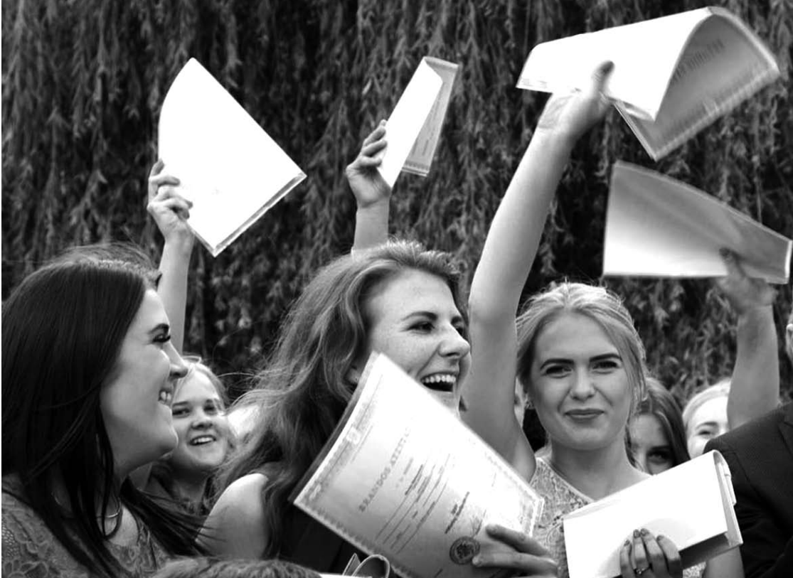
Dvylikos metų darbo vaisiai – jau abiturientų rankose...

XX-ajai J. Biliūno gimnazijos dvyliktokų laidai buvo įteikti brandos atestatai.