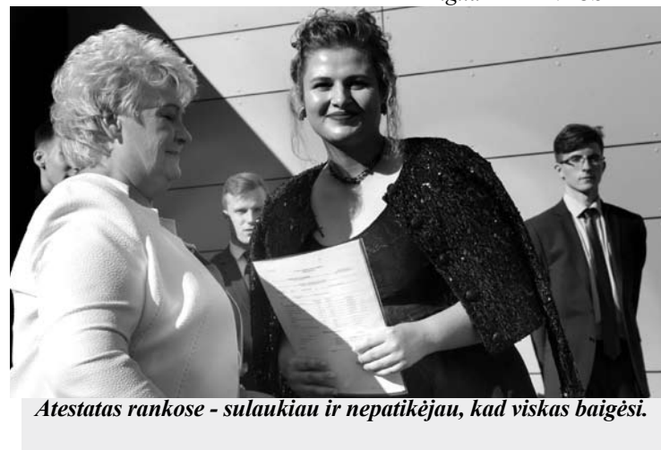
Atestatas rankose - sulaukiu ir nepatikėjau, kad viskas baigėsi.