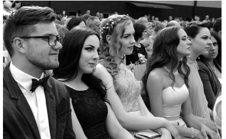
Didžioji dalis 4f klasės mokinių gimnazijoje mokėsi vos dvejus metus.