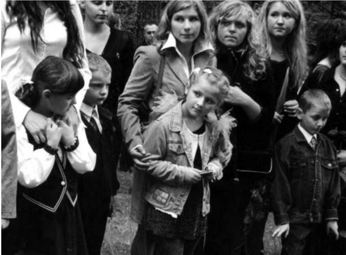
Pirmoje klasėje negalėjau patikėti, kad kada nors sulauksiu išleistuvių.

Liepos 12 d. vyko Jono Biliūno gimnazijos 20-os abiturientų laidos išleistuvės. Tarp jų buvau ir aš. Atestato negavau, nes parašiau apeliaciją, tad mano darbas bus nagrinėjamas dar kurį laiką, bet kaip ten bebūtų, oficialiai aš vis tiek palikau mokyklą, o ji teisę mane pamiršti turės po maždaug metų (ateinančius mokslo metus dabartiniai trečiokai dar kurį laiką turėtų būti lyginami su mūsų laida). Na, bet arčiau esmės.